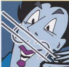
32 Passend zum Schwerpunktthema „Comic & Kunst“ bringen wir die komplette Comic-Biographie „Salvador Dali“ zum Selberbasteln.