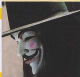
56 Berichte und Interviews rund um die Verfilmung des großen britischen Comic-Klassikers „V wie Vendetta“.